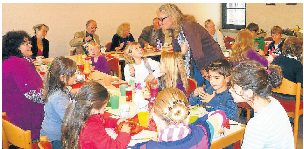
Frühstück mit dem Landrat statt Schule gab es gestern für 15 Kinder in der Arbeitsagentur. FKN

Und wer bezahlt das Ganze? Das Kultusministerium, findet der Landrat – das habe sich den schulfreien Buß- und Betttag ausgedacht. „Ich werde denen die Rechnung schicken“, kündigte er gestern an.