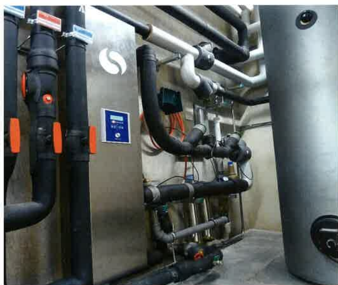
Eine kompakte Anlage zur sicheren Filterung des Trinkwassers

Während herkömmliche Maßnahmen wie Heißwasser- oder Chlordesinfektion die Vermehrung der Legionellen nur kurzzeitig bremsen, oft aber nach Beendigung der Maßnahmen zu verstärktem Wachstum führen, wird das Vermehrungspotenzial von Mikroorganismen durch den Einsatz der Seccua-Filtration dauerhaft vermieden. Nach Einbau einer Seccua-Filtration am Hauswassereingang (POE) können keinerlei Keime mehr in das Leitungsnetz des Hauses eindringen. Mikroorganismen, Rostpartikel, Amöben und Biomasse werden so bereits am Übergang vom Stadt- zum Hausnetz vollständig entfernt, wodurch die Vermehrung von Legionellen im gesamten Trinkwasserleitungssystem ganzheitlich unterbunden wird. Der wichtigste Schritt gegen Keime im Leitungssystem ist nämlich die Entfernung jeglicher, also auch der toten Mikroorganismen und somit einer erheblichen Biomasse sowie die maximale Reduzierung eventuell vorhandener Nährstoffe. Gelingt das, bilden sich selbst vorhandene Biofilme und Keimzahlen im Leitungsnetz zurück. Langzeittests haben gezeigt, dass sogar stark verkeimte Rohrleitungsnetze so wieder auf ein hygienisch einwandfreies Maß zurückgeführt werden können. Statt durch herkömmliche Maßnahmen und Technologien wie thermische Desinfektion das Wachstum der Legionellen nur einzudämmen, werden sie so rückstandslos entfernt.