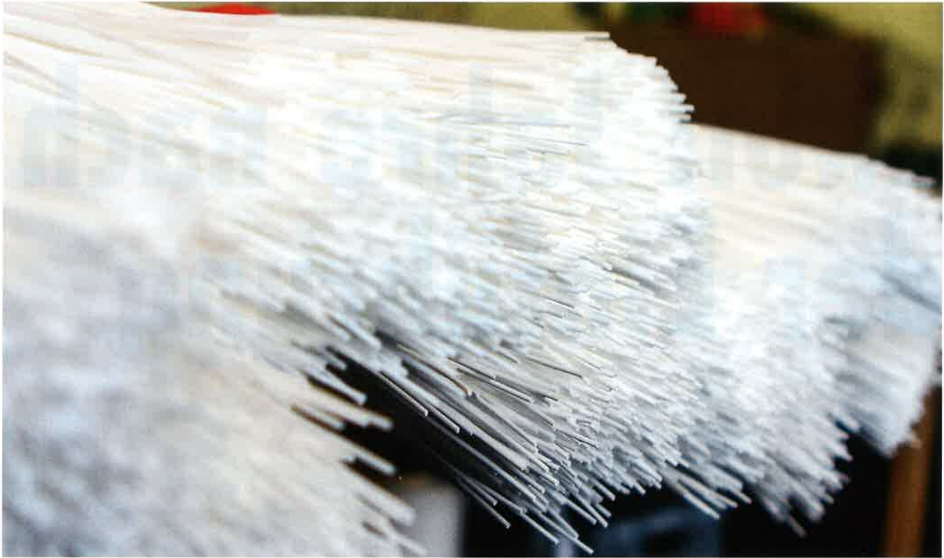
Ein Membranfaserbündel einer Seccua-Filtrations-Einheit

an den meisten Auslaufarmaturen ausgestattet sein, die das mit hohem Energieaufwand aufgeheizte Wasser durch Mischung mit Kaltwasser wieder auf 38°C abkühlen. Um dieses Dilemma zu lösen, wurde eine verfahrenstechnische Lösung gesucht und bei Seccua gefunden.